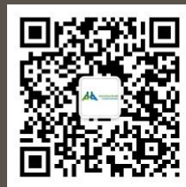
微信公众号二维码