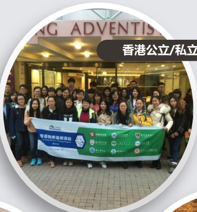
香港公立/私立医院参观