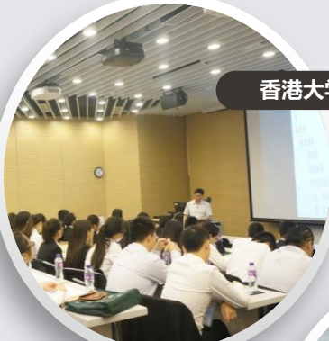
香港大学医学讲座