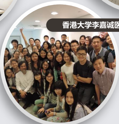
香港大学李嘉诚医学院参观